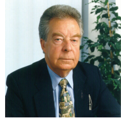
Lord Imbert QPM JP Chairman

Capital Eye is a unique Security and Policing based company now internationally recognised and respected for quality of service. An independent and impartial organisation, it specialises in policing and allied consultancy activity, advising on and implementing a variety of project solutions. As sensitive facilitators, our consultants help to introduce and to sustain organisational change, and to build organisational and personal capacity in challenging policing and public sector environments.