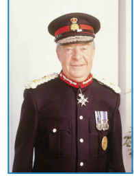
Lord Imbert QPM JP Chairman

Capital Eye Ltd, Metropolitan Polis Teşkilatın bir önceki Şube Müdürü olan Sayın Lord Peter Imbert tarafından 1990 yılın sonlarına doğru kurulmuş uluslararası güvenlik şirkettir ve özellikle hükümetlere, güvenlik güçlerine ve tesislerine polis ve güvenlik hizmetleri sunmaktadır. Müşterilerimize pratik tavsiyelerde bulunmakta ve geniş deneyimlerimize dayanarak ve en yüksek ahlaki standartlarımızı muhafaza ederek destek ve eğitim hizmeti vermekte ve müşteri gizliliğine kesinlikle riayet etmekteyiz.